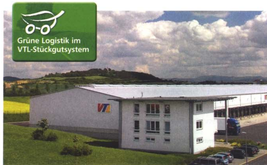
Alle THG-Emissionen erfasst – VTL-Zentrale in Fulda

Ein komplettes CO 2 -Tarifwerk hat Anfang September die Stückgutkooperation VTL veröffentlicht. Welche Ziele das Unternehmen aus Fulda damit verfolgt und wo die Schwierigkeiten bei der Erstellung auftraten.